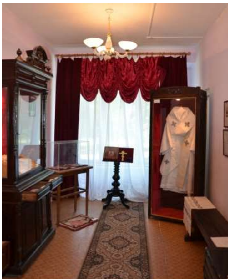
Музей свщм. Онуфрия (Гагалюк) ЧОУ "Православная гимназия №38"