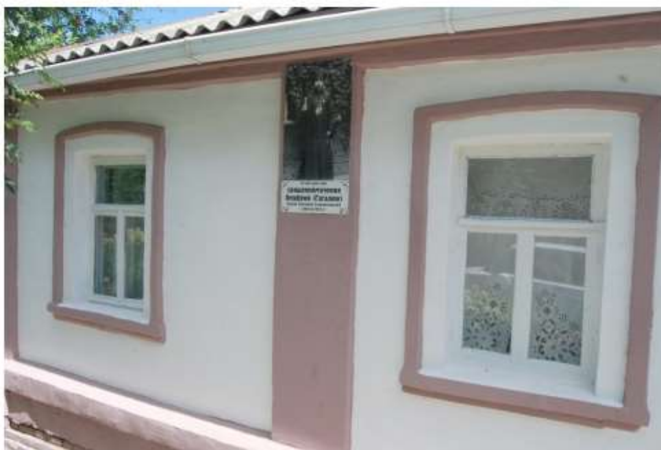
г. Старый Оскол, ул. Пролетарская, 47. Дом, в котором жил священномученик Онуфрий